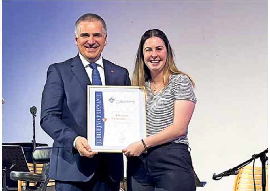
Priznanje za trideset let delovanja je prejelo podjetje Elektro Primožič elektroinštalacije.