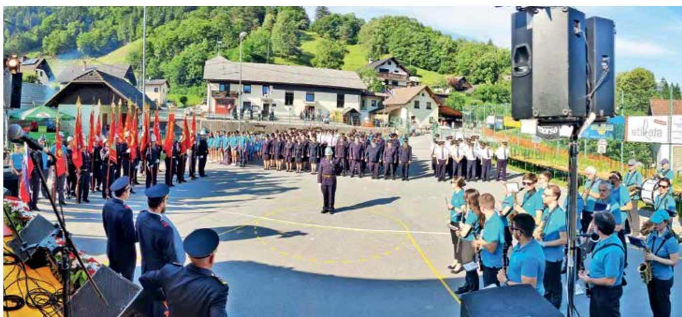
Devetdesetletnico so trebijski gasilci zaznamovali tudi s parado in kulturnim programom.