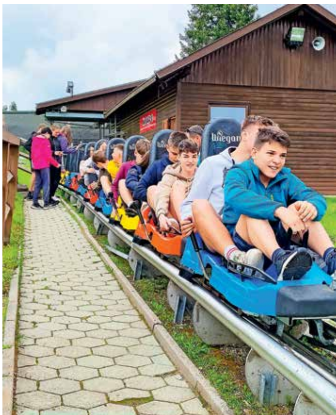
Devetošolci v zadnji šoli v naravi na Rogli