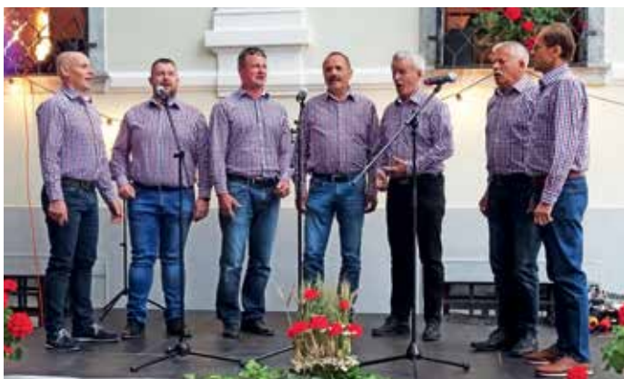
Pevci Vokalne skupine Zala

Pred Dvorcem Visoko je konec junija potekal že tradicionalni Pevski večer.