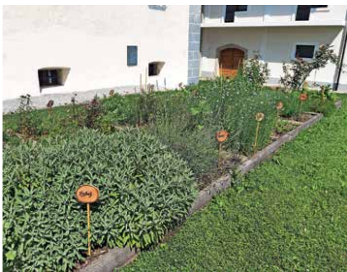
Zeliščni vrt ob Dvorcu Visoko

Pred časom sem uspešno sodelovala na vseslovenskem natečaju za najbolj inovativen, kreativen in funkcionalno urejen vrt.