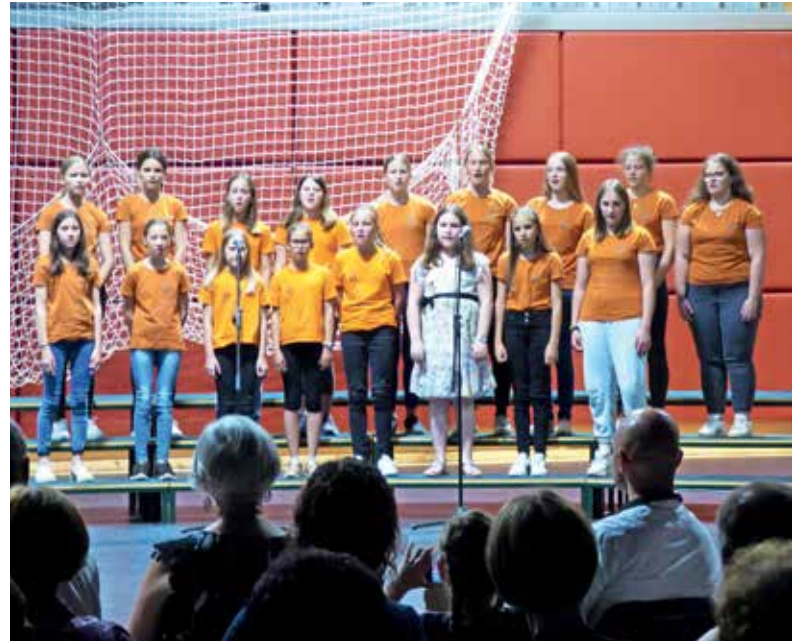
Proslavo ob dnevu državnosti v Poljanah je s svojim nastopom obogatil otroški zbor.