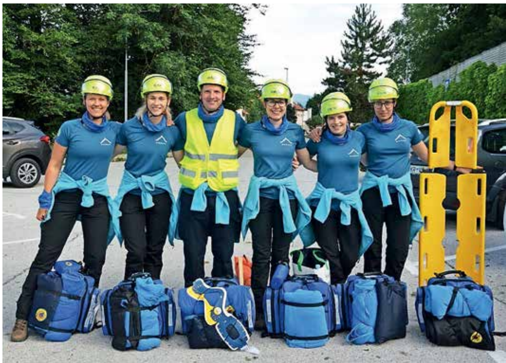
Ekipa prve pomoči Civilne zaščite Občine Gorenja vas - Poljane je bila najboljša na regijskem tekmovanju.

Seveda si člani naše ekipe prve pomoči, ki je usposobljena za reševanje v prime-