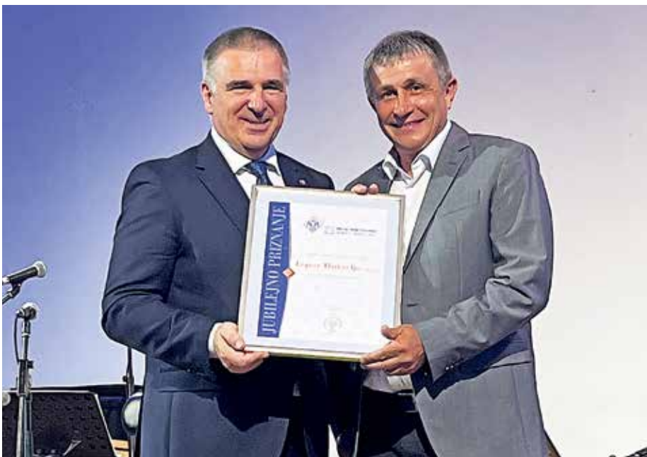
Trideset let že dejavnost opravljajo tudi v podjetju Topos Hotavlje.

Kot zanimivost: Konec junija je bilo v občini Gorenja vas - Poljane registriranih 428 samostojnih podjetnikov, 156 družb z omejeno odgovornostjo ter 60 dopolnilnih dejavnosti na kmetiji.