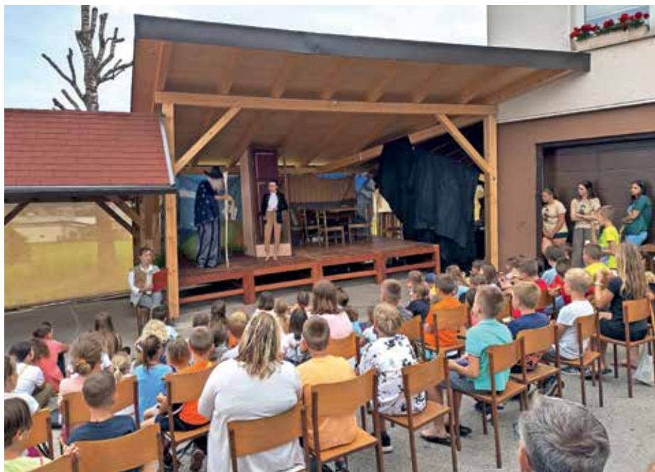
Otroci in starši so si na odru pred župniščem na Trati pozorno ogledali oratorijsko igro o Hobitu.