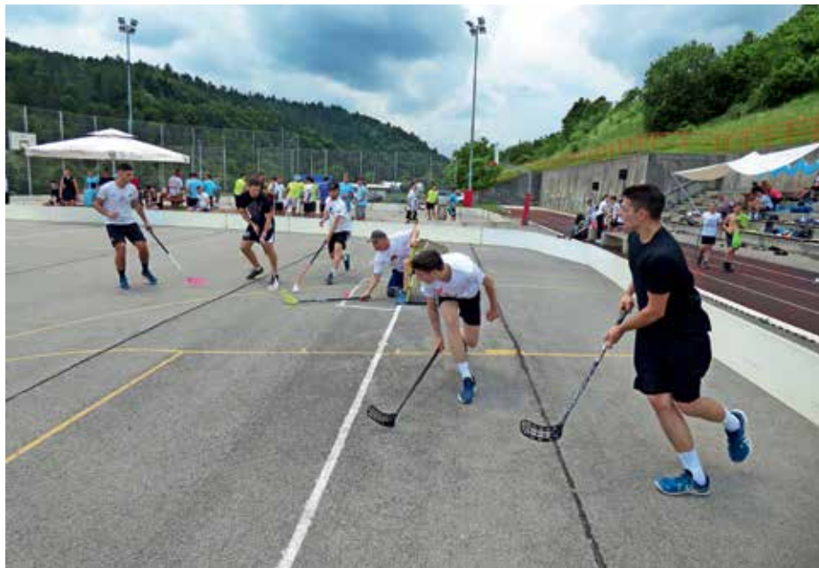
Ves dan so potekali dvoboji ekip na igrišču ob poljanski šoli.

Zmagovalci turnirja so po finalnem obračunu postali člani ekipe K.O.Z.E., na drugo mesto so se uvrstili Štangarji, na tretje pa Sladki carji. Vzporedno je na dodatnem igrišču za floorball potekal Osnovnošolski ŠvicBol, ki je bil sicer planiran za nedeljo 11. junija, a so ga prestavili na soboto, ker so se prijavile samo štiri ekipe. Zmagali so Pokemoni, drugi so bili člani ekipe Loke, tretji pa člani ekipe FBK Žiri 2. Kot del spremljevalnega programa je potekal Beer pong turnir, ki je pritegnil marsikoga. Po