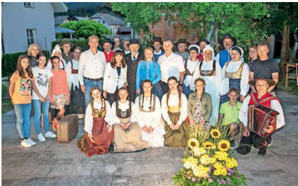
Sodelujoči v kulturnem programu ob dnevu državnosti v Gorenji vasi