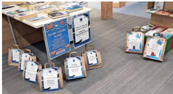
Kitkove vrečke presenečenja